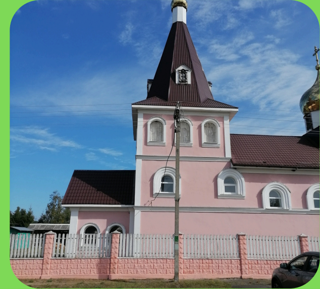
2.ХРАМ В ЧЕСТЬ ВЕЛИКОМУЧЕНИЦЫ ВАРВАРЫ В Д.БОРОВИКИ