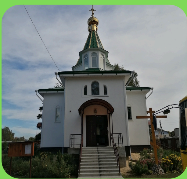
1.ХРАМ СВЯТИТЕЛЯ НИКОЛАЯ ЧУДОТВОРЦА В Д.ЯКИМОВА СЛОБОДА