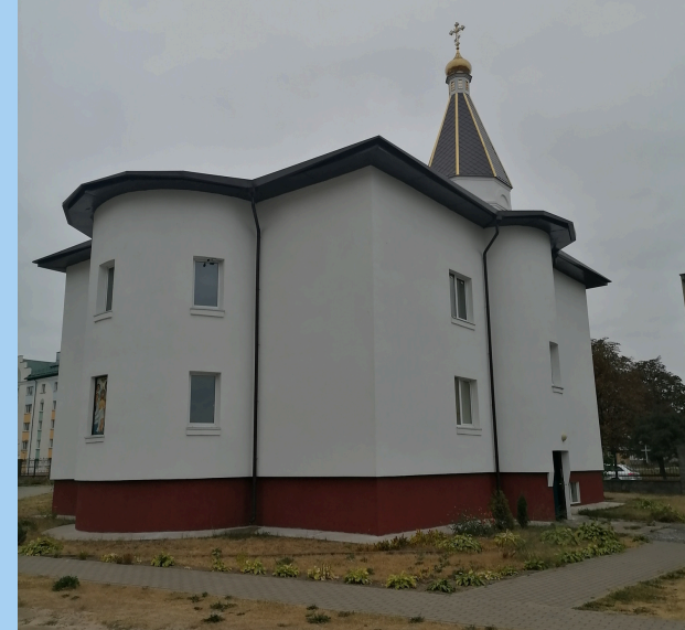
3. ХРАМ СВЯТОГО ПРЕПОДОБНОГО АМВРОСИЯ ОПТИНСКОГО И СВЯТОГО ВЕЛИКОМУЧЕНИКА ПАНТЕЛЕИМОНА