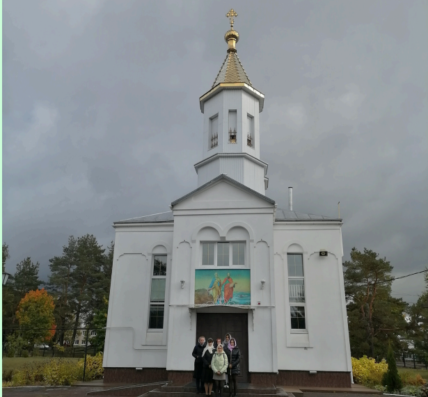
1. ХРАМ В ЧЕСТЬ СВЯТЫХ ПЕРВОВЕРХОВНЫХ АПОСТОЛОВ ПЕТРА И ПАВЛА