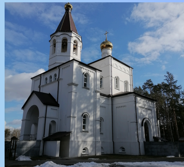
4. ХРАМ СВЯТИТЕЛЯ КИРИЛЛА ТУРОВСКОГО